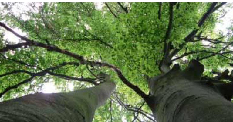
Die Gefährdung durch umstürzende Bäume wird gutachtlich bewertet.